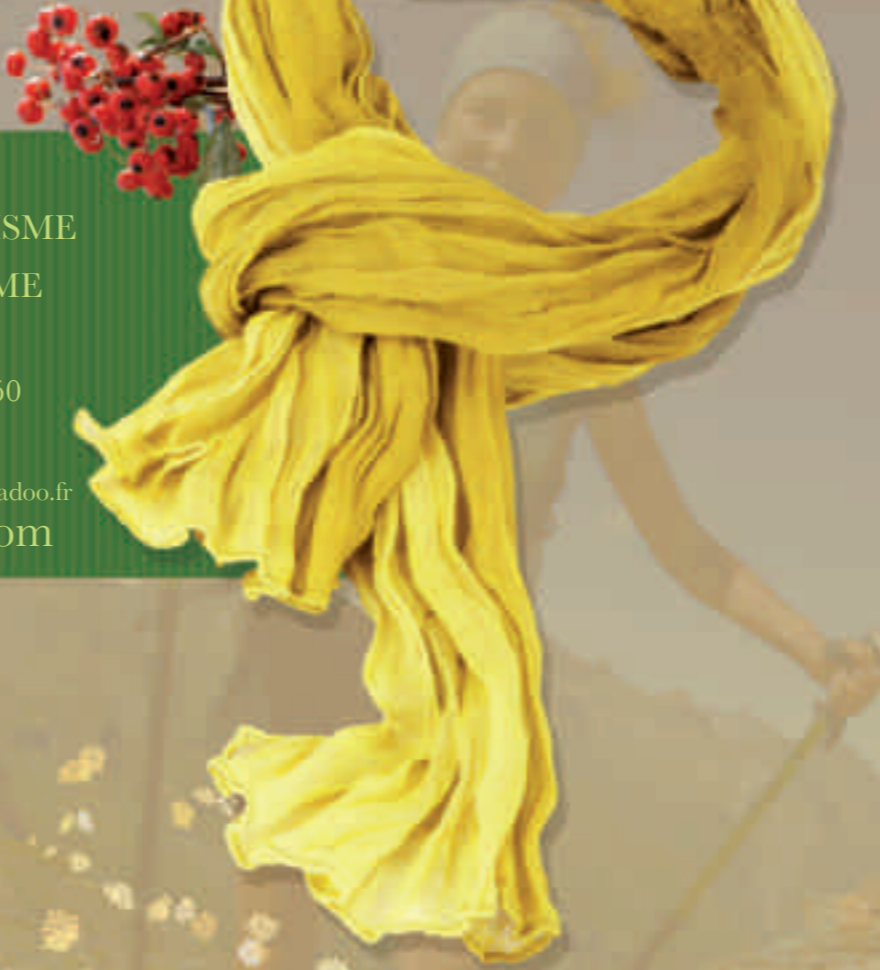
©Création Esqui's : www.agence-esquiss.com

OFFICE DE TOURISME & DU CLIMATISME DE BRIANÇON Tél. 33 (0)4 92 21 08 50 1, Place du Temple 05105 Briançon Cedex office-tourisme-briancon@wanadoo.fr www.briancon.com