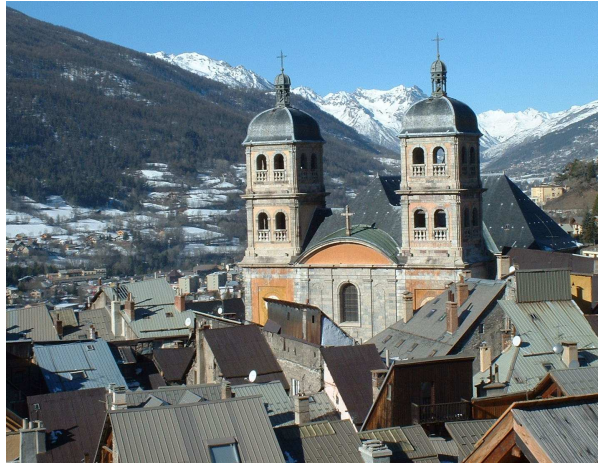
La Collégiale Notre-Dame Saint-Nicolas

Les remparts de Briançon projetés par Vauban constituent un excellent exemple d'enceinte bastionnée adaptée à un site escarpé. L'architecte militaire a su tirer parti des défenses naturelles du site, côté Durance mais aussi de ses difficultés liées aux positions dominantes.