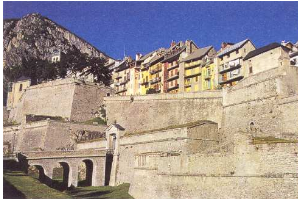
Le front d'Embrun et ses façades colorées

«A l'égard de la campagne, on ne peut rien imaginer de plus inégal, ce sont des montagnes qui touchent aux nues et des vallées qui descendent aux abîmes ; le milieu entre deux est composé de ces extrémités qui font tout le haut et bas imaginable et par conséquent très embarrassant pour ceux qui attaqueront et qui défendront » Vauban.