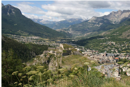
La cité Vauban sur son verrou glaciaire